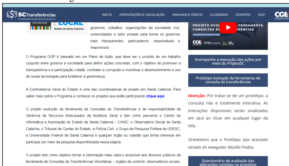
Imagem 1 - Print Screen da tela com a aba “OGP”