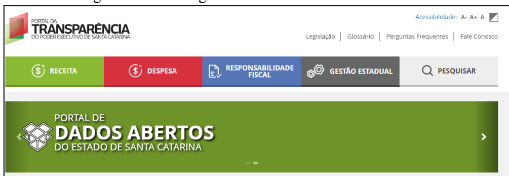
Figura 5 - Banner giratório no Portal de Dados Abertos

Os links para a API no Portal de Dados Abertos para cada consulta ainda não foram implementados até o momento, pois aguarda recursos e melhoria na infraestrutura das máquinas virtuais (servidores dos dados abertos).