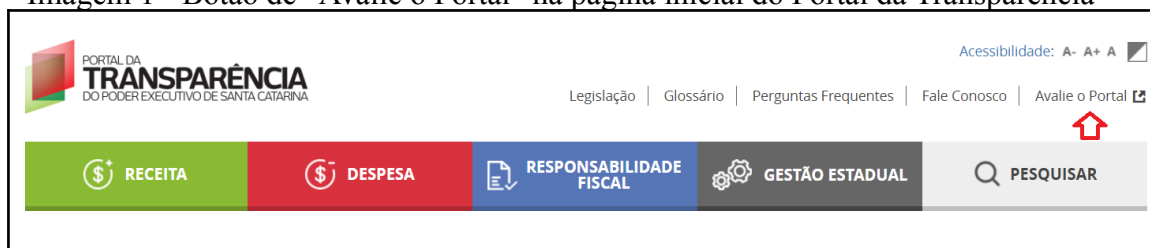
Imagem 1 - Botão de “Avalie o Portal” na página inicial do Portal da Transparência