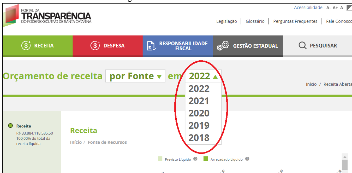
Imagem 3 - Tela “Receita Aberta”