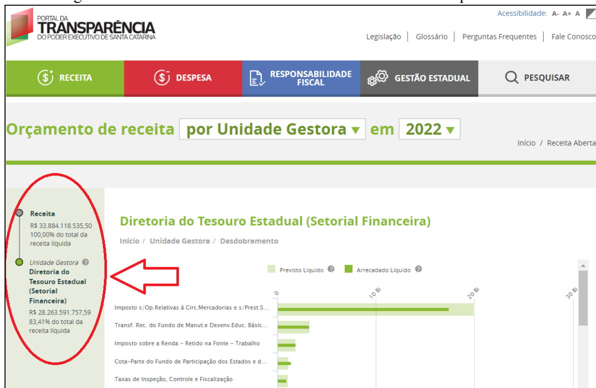
Imagem 7 - Tela “Receita Aberta” indicando ao usuário o nível que se encontra

O menu lateral ajuda a entender em que ponto do nível da informação o usuário está, conforme mostra a figura abaixo, podendo ser clicado para voltar em determinado passo: