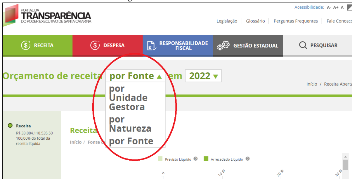
Imagem 2 - Tela “Receita Aberta”