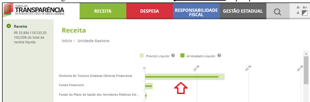
Imagem 4 - Tela “Receita Aberta” no primeiro nível de pesquisa