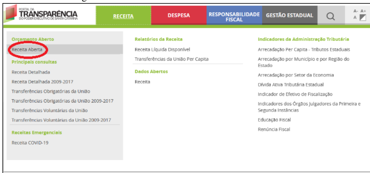
Imagem 1 - Tela “Receita” indicando a aba “Receita Aberta”