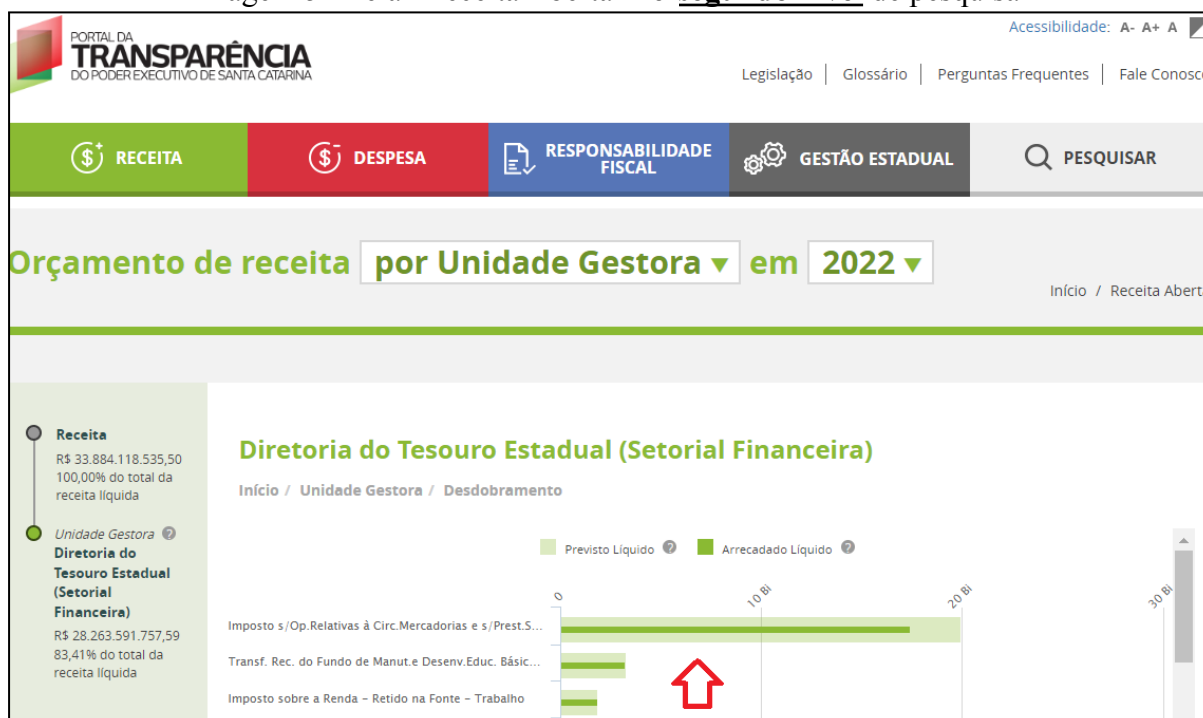
Imagem 5 - Tela “Receita Aberta” no segundo nível de pesquisa